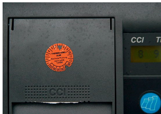
kalibrierter Temperaturlogger nach EN13486

Der Wartungsdienst nach HACCP-Kriterien von Thermo King Süd, wurde in Zusammenarbeit mit der ATP-Prüfstelle des TÜV-Süd in München entwickelt. Um immer auf dem aktuellen Stand zu bleiben, wird auch Thermo King Süd jährlich einer wiederkehrenden Überprüfung unterzogen.