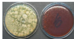
Abklatschprobe vor der Innenreinigung