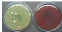
Abklatschprobe nach der Innenreinigung