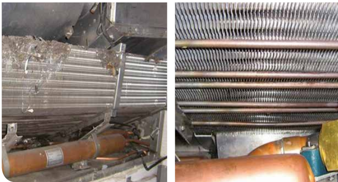
Verdampfer vor und nach Reinigung und Desinfektion